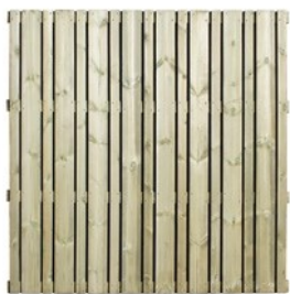
Arnato panneau en pin

Grâce à nos nombreuses années d'expérience dans le secteur du bois, nous avons développé des écrans et des portails de jardin en bois durables et parfaitement finis. Ils partent de nos ateliers à Gits et sont déposés dans votre jardin par l'un de nos distributeurs professionnels .