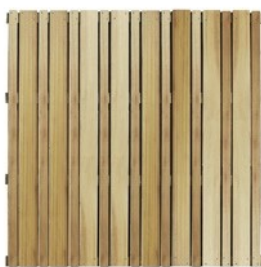
Arnato panneau en iroko