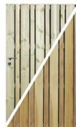
Arnato portail de jardin